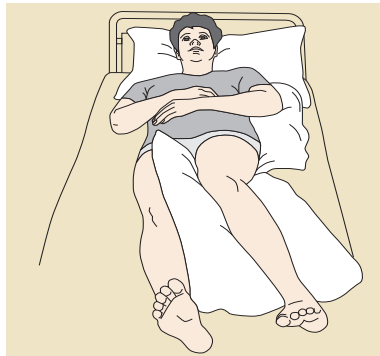
30°-Schräglagerung mit zwei Kissen

En général il suffit déjà de déplacer légèrement une partie du corps ou de soulager cette partie en plaçant un coussin plat ou un linge éponge plié. Chez les patients étant longtemps assis, il faut observer que la surface de compression sur les fesses est plus grande que lors d'une position couchée. Il existe des moyens spéciaux pour une décharge de compression aussi bien en position assise qu'en position couchée.